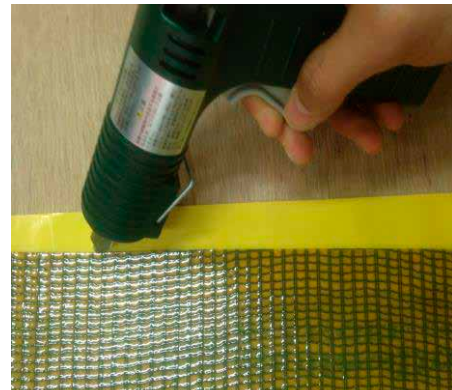
テープの中にホットメルト等で絶縁を行う