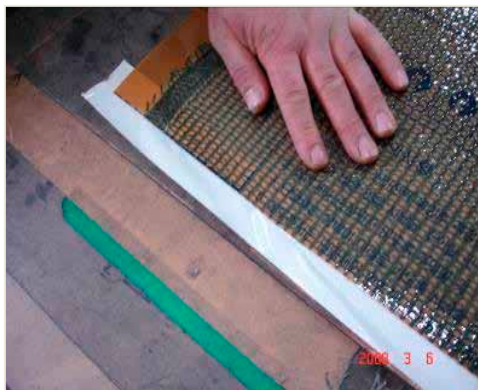
絶縁テープで発熱体の裁断部位を絶縁を行う

(この時、必ず図のように絶縁部分にシリコンなどで絶縁した後、絶縁テープを付けて下さい。