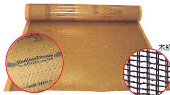
エンドレスドリームODP1500 高出力遠赤外線シート