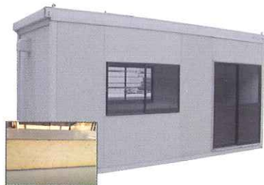
パネル式組み立てハウス