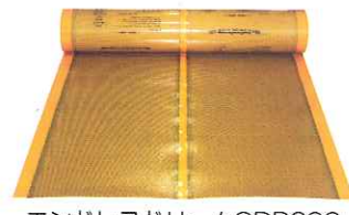
エンドレスドリームODP600 高出力遠赤外線シート