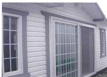
軽量鉄骨コンテナハウス住居