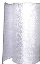
エンドレスフォームG3T 不燃性・高性能遮熱・断熱・ 防音・防水機能断熱材 日本工業試験場性能試験 国土交通大臣認定出願中