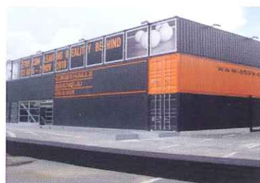
軽量鉄骨コンテナハウス多目的