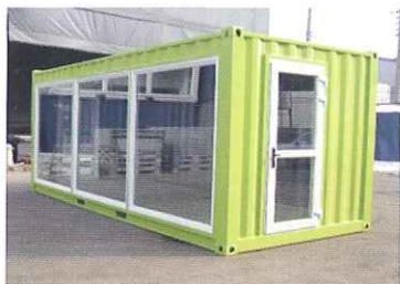
軽量鉄骨コンテナハウス店舗